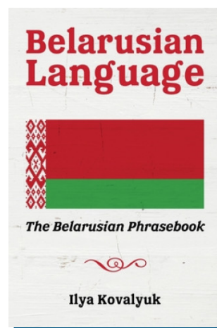
Фота 3. Беларуская мова: Беларускі фразавы даведнік

Раней, у 2016 г., Ілья Кавалюк выдаў “Беларуская мова: Беларускі фразавы даведнік” ( Belarussian Language: The Belarussian Phrasebook )